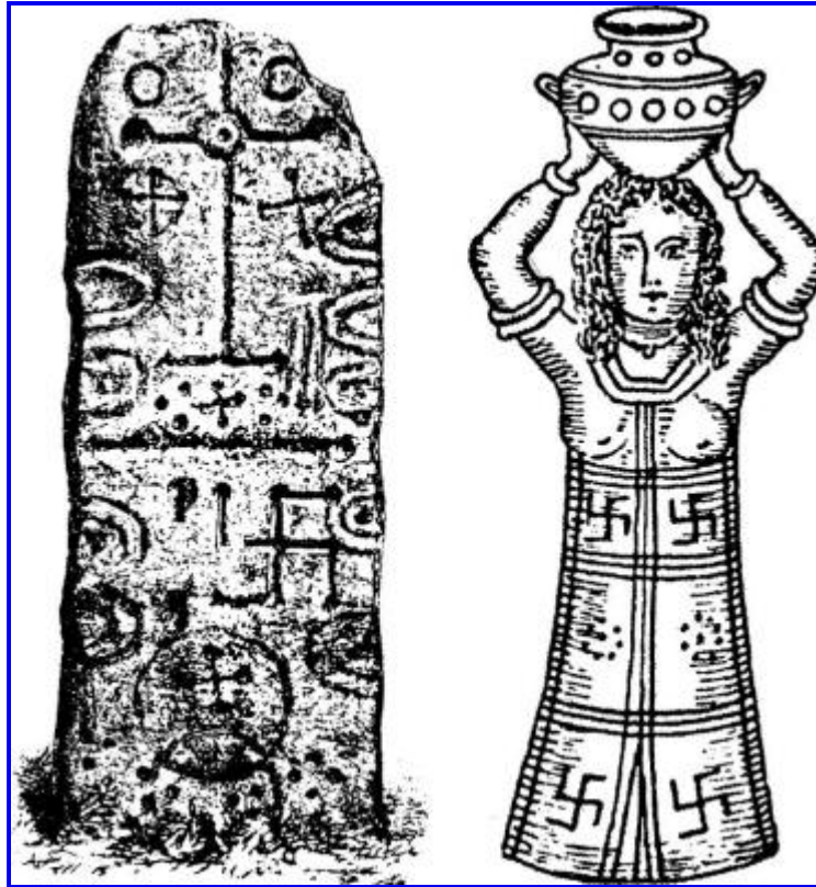
Figure 10 : La croix gammée, symbole du soleil phénicien, sur la pierre phénicienne Craig-Narget en Écosse et, Figure 11, sur la robe d'une grande prêtresse phénicienne.

Une croix gammée peut être vue sur une pierre dédiée au dieu solaire phénicien Bel , trouvée à Craig-Narget en Écosse et utilisée pour décorer les robes de leurs grandes prêtresses (voir figures 10 et 11).